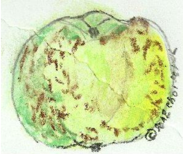
Pastel Choisel Jean-Louis 2012 © selon Diel